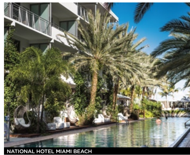
NATIONAL HOTEL MIAMI BEACH