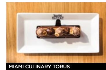
MIAMI CULINARY TORUS